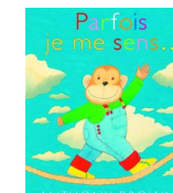
Anthony Browne Ed. Kaléidoscope