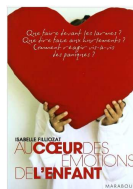
Isabelle Filliozat «Au cœur des émotions De l'enfant» Ed. JC Lattès, 1999