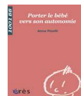
Anna Pinelli «Porter le bébé vers son autonomie» Ed. Erès, 2008